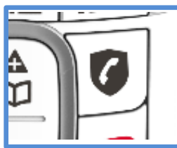
Touche de blocage des appels