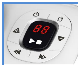
Un compteur pour vous informer du nombre de nouveaux messages