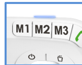
3 touches de mémoires directes (base répondeur et combiné) et une touche de prise d'appel sur la base répondeur